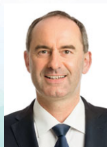
Hubert Aiwanger Staatsministerium für Wirtschaft, Landesentwick- lung und Energie

Bereits heute haben folgende Sprecherinnen und Sprecher zugesagt: